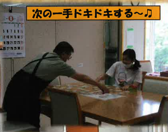
次の一手ドキドキする～♪