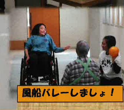
風船バレーしましょ!