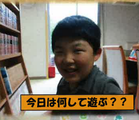
今日は何して遊ぶ??