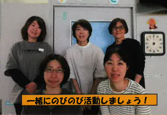
一緒にのびのび活動しましょう!