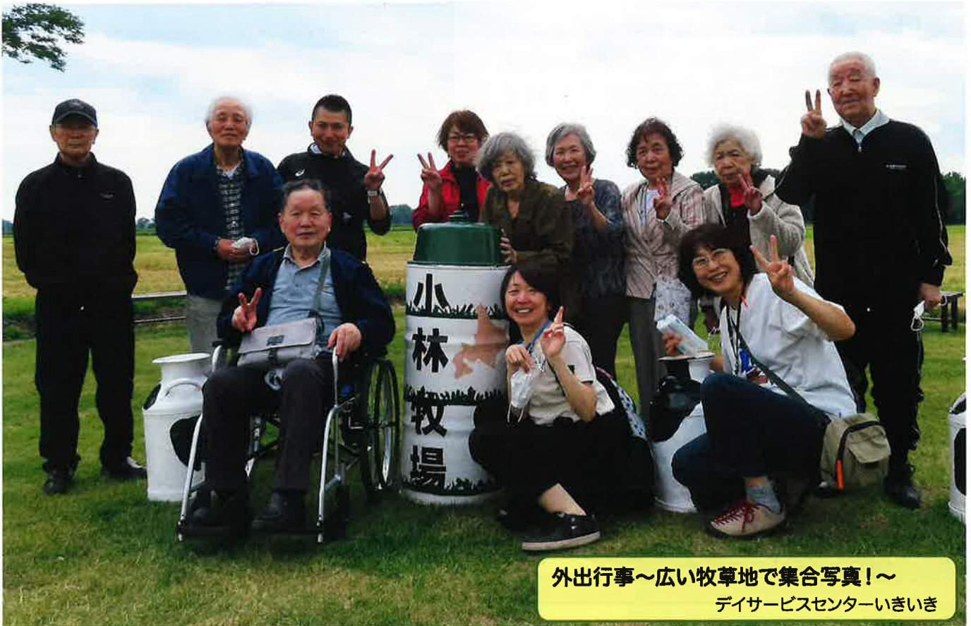
外出行事～広い牧草地で集合写真!～