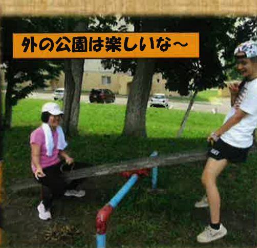
外の公園は楽しいな～

日中一時支援とは、障がいをお持ちの方の家族の就労支援や日常的に介護している家族の一時的休息など、障がいのある方の日中活動の場を提供します。