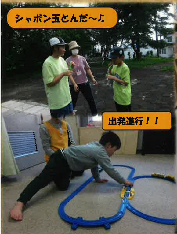
シャボン玉とんだ～♪

日中一時支援とは、障がいをお持ちの方の家族の就労支援や日常的に介護している家族の一時的休息など、障がいのある方の日中活動の場を提供します。