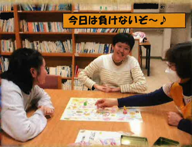
今日は負けないぞ～♪