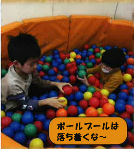
ボールプールは 落ち着くな～