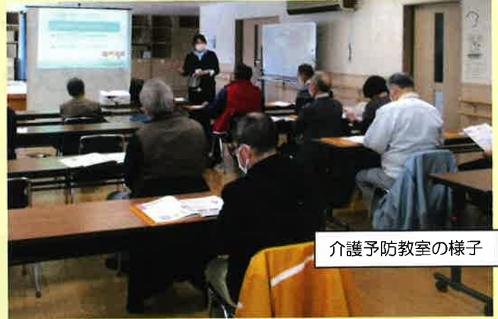
介護予防教室の様子

「高齢者の生活を地域で支えていくための拠点」として、江別市からの委託を受けて活動しています。高齢者に関する「総合相談窓口」「要支援1・2と認定された方の予防プランの作成」「権利擁護活動」のほか、いつまでも自立した生活が続けられるように『介護予防』の啓発にも積極的に取り組んでいます。介護予防教室への参加や各種出前講話の依頼などがありましたらご連絡ください。